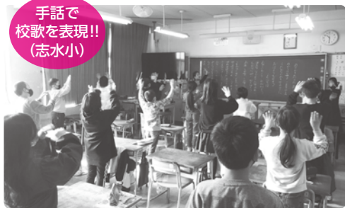
手話で校歌を表現!! (志水小)

令和3年10月27日(水)豊山小学校、11月25日(木)新栄小学校、12月13日(月)志水小学校で福祉実践教室を開催していただきました。各校手話や点字の体験を実施しました。