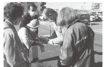
西友 豊山店 12月11日 (豊山町赤十字奉仕団のご協力)