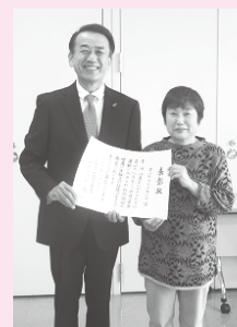
池山会長と岡島委員長