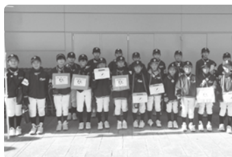
エアポートウォーク名古屋 12月11日 (豊山フェニックス少年野球クラブのご協力)